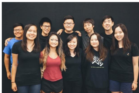
(a) Small Group member

https://www.youtube.com/watch?v=uQsEsNLwcDc