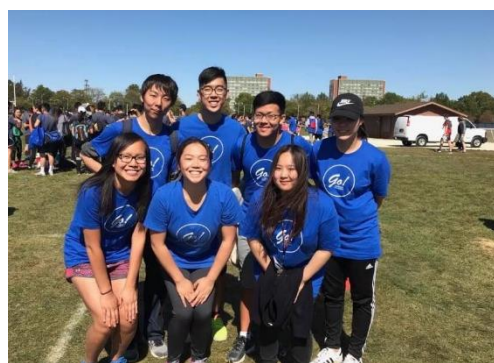
(b) Mini Olympics