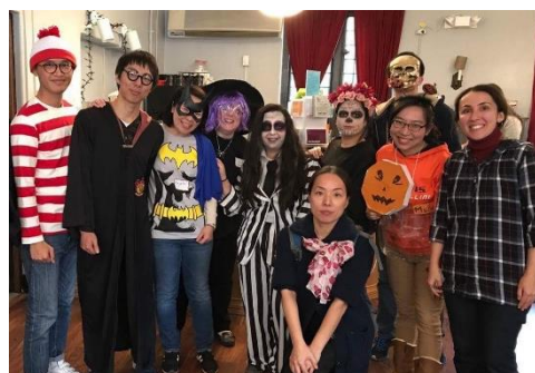
(b) ハロウィンパーティ