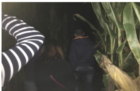
(a) 広大なコーン迷路

毎週木曜日にアメリカの文化を勉強・体験できるイベントが開催されます。さらに月に1、2回ほど別途に様々なイベントを企画してくれます。これまでに広大なコーン畑の迷路や綱渡り、りんご狩りのイベントに参加しました。English Corner にメールアドレスを登録しておけばイベントの詳細をチェックできるので興味があるときにだけ参加するといった感じです。個人的にはとてもお勧めの団体です。